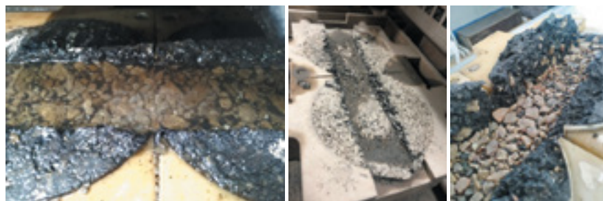
Рис. 1. Отрицательный результат испытания асфальтобетона на устойчивость к колееобразованию в воде с металлическим колесом (отсутствует адгезия)

Результаты могут отличаться от испытания асфальтобетонной смеси и зависят от многих факторов, но в основном это качество уплотнения, содержание воздушных пустот, время, затраченное на технологический процесс, и состав асфальтобетонной смеси.