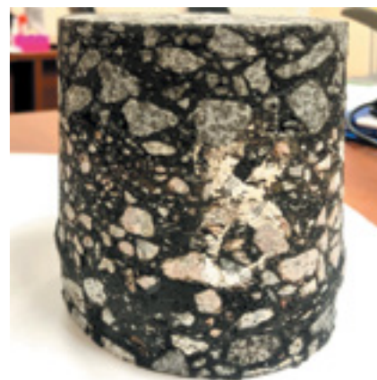
Рис. 4. Характерный выпор («юбка») в месте соприкосновения старого фрезерованного слоя и свежеуложенного асфальтобетона

Сдвиговые деформации распространяются на глубину 10–11 см, таким образом при замене одного только верхнего слоя и при испытании двухслойного керна мы зачастую видим картину, что нижний, старый слой деформируется под воздействием нагрузки, в то время как верхний слой остается практически неповрежденным. Еще одна тенденция, выявленная при испытании кернов, – это